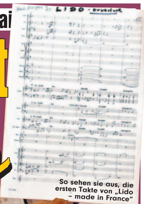
So sehen sie aus, die ersten Takte von „Lido - made in France“